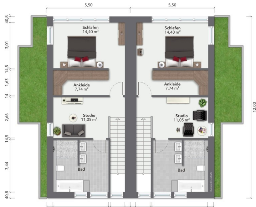
Exposeplan-36059001404-DINA4 jpg 2. OG