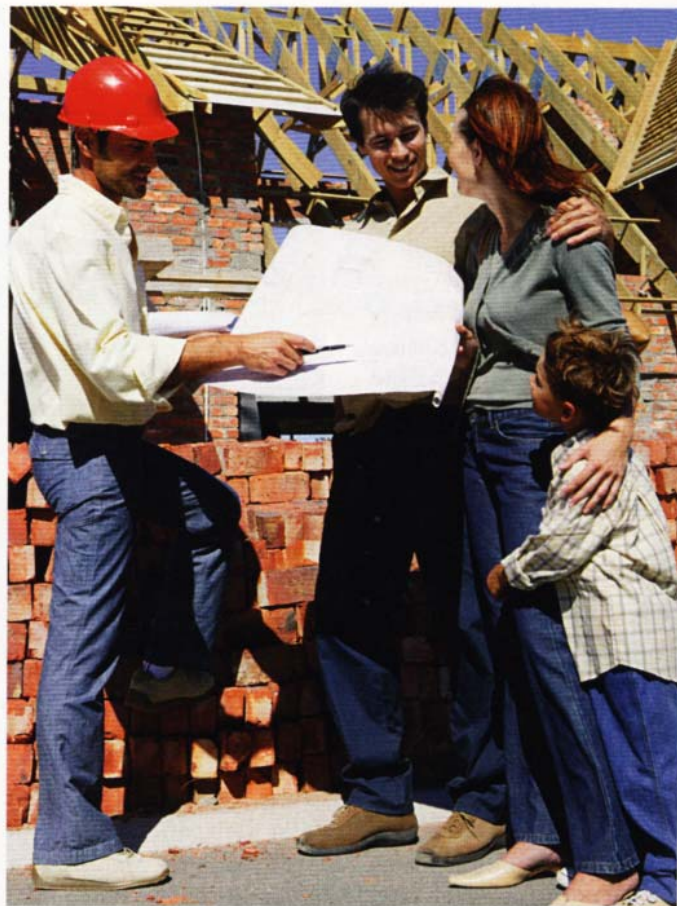
Damit das Traumhaus kein Alptraum wird, sind genaue Vereinbarungen nötig, die man als Laie nicht kennen kann.

Undichtigkeiten geprüft. So ist es richtig. „Es lohnt sich, regionale Qualitätsfirmen zu beauftragen“, betont der Beratungsarchitekt. „Die haben ein Interesse am nächsten Auftrag.“ Das mag auf den ersten Blick teurer sein, aber eine Geiz-ist-geil-Mentalität führt fast immer zu Pfusch und sorgt für Ärger, fügt er hinzu und erzählt von vergessenen Abdichtungen, nassem Holz für den Dachstuhl und zahlreichen weiteren Mängeln, die der Laie nicht einmal erkennen würde, wenn er davorsteht.